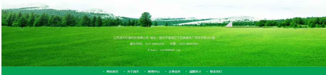
图 2.2-1 第一次公示