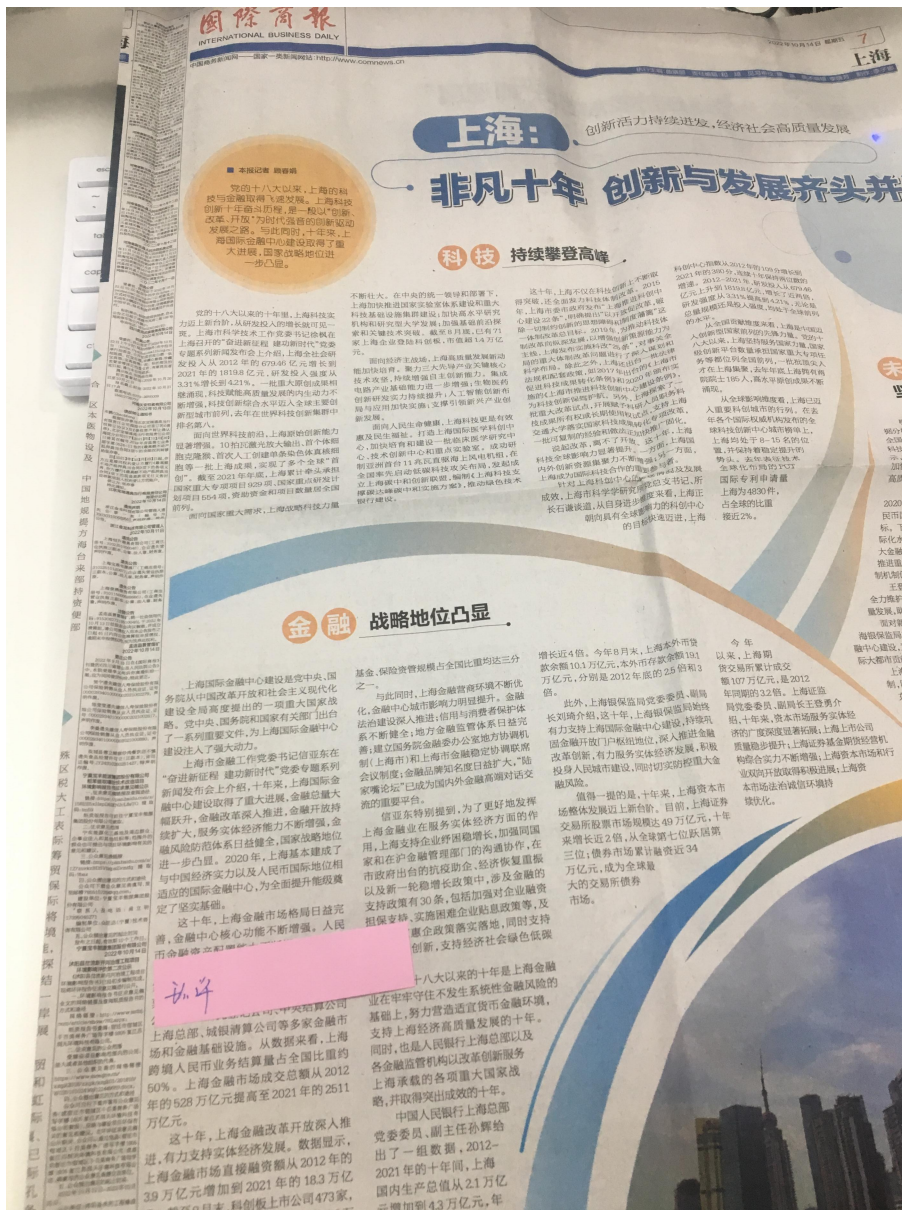
图 3.2-2 征求意见稿报纸公示报纸截图

充分听取公众对建设项目的意见和建议，更好地执行有关国家环境保护的方针政策，建设单位进行了报纸公示，公示报纸截图见图 3.2-2。