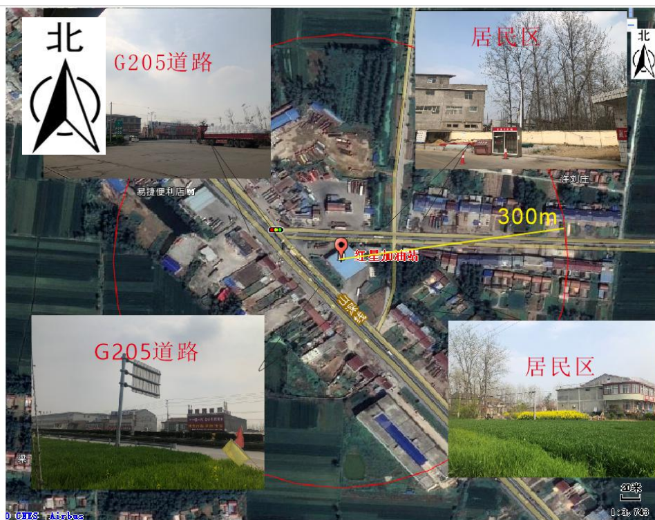
附图4 项目周边现状图

本项目位于宿迁市沭阳县胡集镇京沪高速出口处，方便过往车辆加油。北临富海路，西国道 205，南侧为国道 205，东侧为居民区。